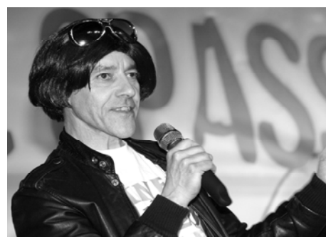
Mickie Krause alias Rainer Müller hatte „Nur noch die Schuhe an“