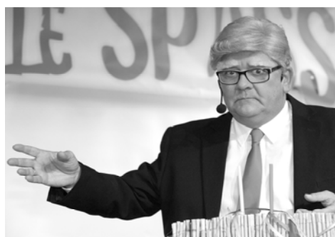
US-Präsident Donald Trump alias Gerhard Laubersheimer war nicht sehr beliebt