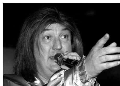
Jürgen Drews alias Jürgen Müller sang von einem „Traumschloss“