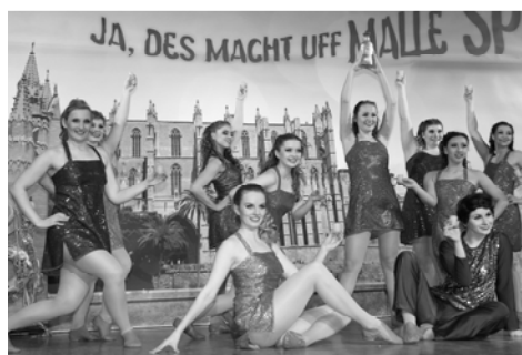
Immer wieder „Diamanten“: die Tänzerinnen der Showtanzgruppe des Tanzstudios Dauth