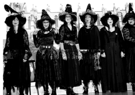
Die Sausummer Hexen heizten mit einer ein- maligen Show die Stimmung im WSC an