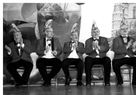
Saßen wie die „Hühner auf der Stange“ und verfolgten die Prunksitzung: Fünf Elferräte