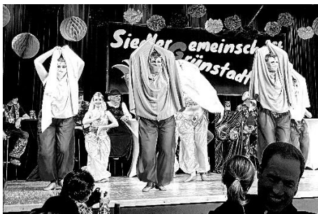
Die Showtanzgruppe von Dance In