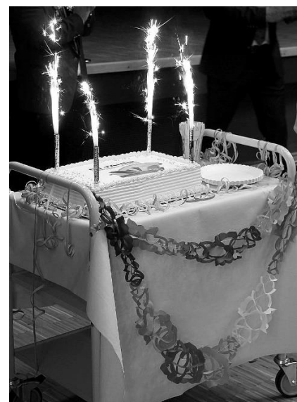
Mit dieser Geburtstagsstorte gratulierte die Stadt Grünstadt den Siedlerfasnachtern zum Faschnachtsjubiläum.

Auf alle Fälle wollen die Siedlernarren innovativ tätig sein und zeigen, dass man mit etwas Lächeln, Witz und Humor gut durch das Leben kommt und sich auch Aufgaben und Probleme in Verwaltung und Politik lösen lassen.