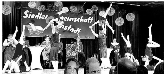
Die Crazy Jumpers von der TSG Eisenberg