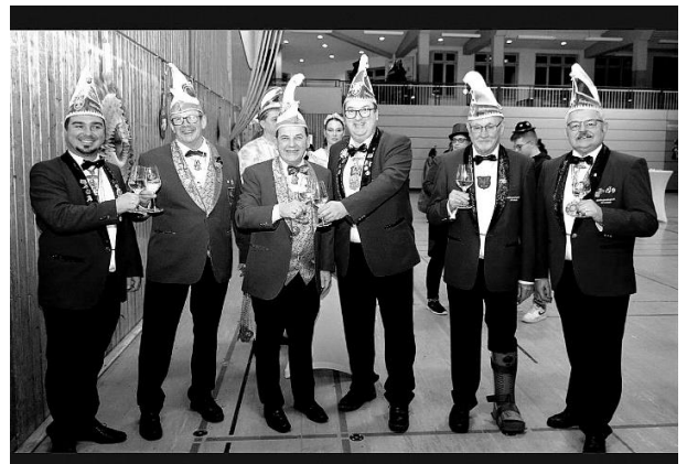
Siedler-Abordnung in Osthofen - Prunksitzung am 28.1.2023 des „Carneval Club“ Osthofen