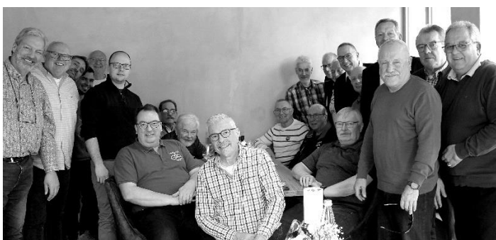
Heringssessen am 22.2.2023 im Grünstadter Restaurant „Kabale und Liebe“