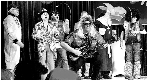
Ein Teil der Siedlergruppe