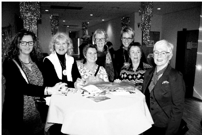
Die Damen einiger Siedler-Elferräte beim Ordensempfang am 2.2.2023