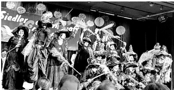
Die Sausummer Hexen