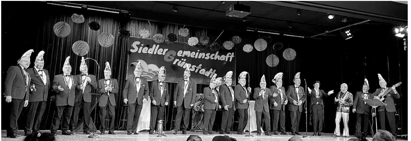
Der Elferrat der Siedlergemeinschaft