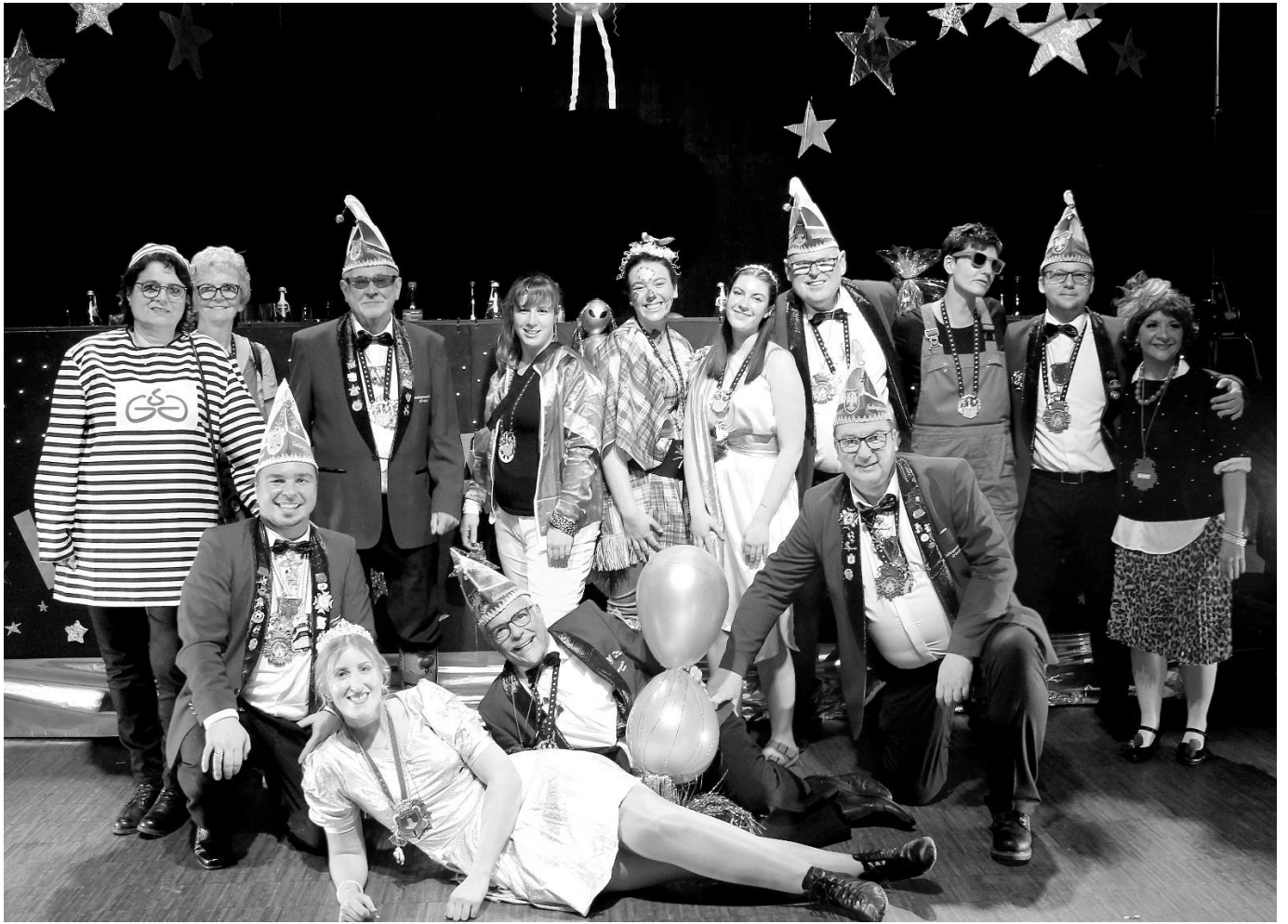
Die Delegation der Siedlerfasnachter bei der Prunksitzung am 11.2.2023 des KV „Gaumenkitzler“ Dirmstein