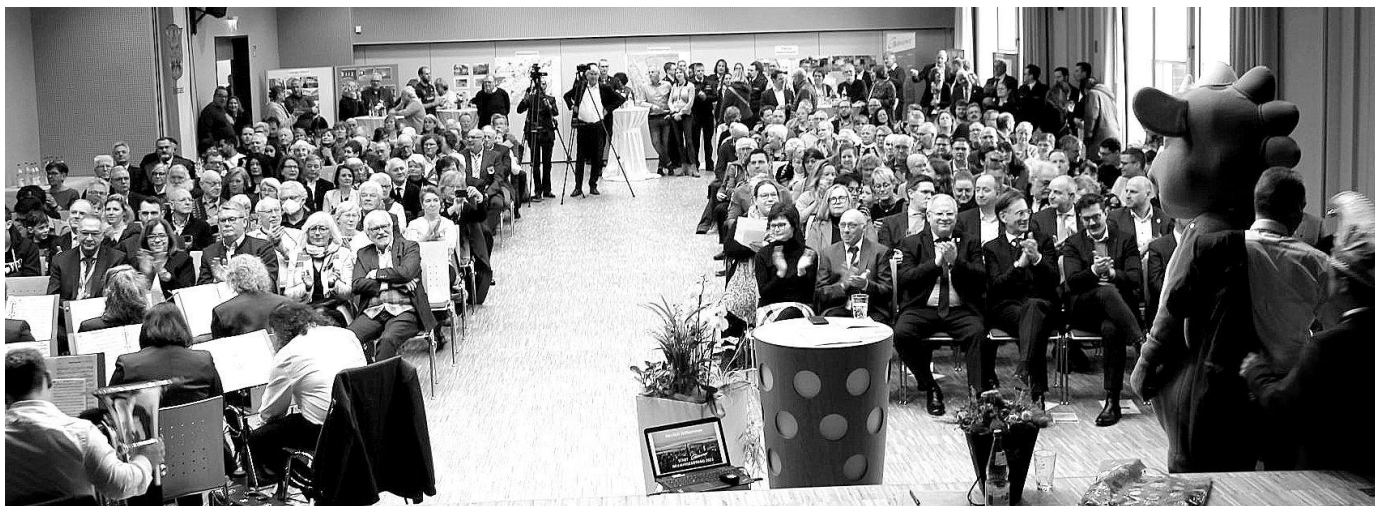
Bis auf den letzten Platz besetzt war der Saal des Weinstraßencenters Grünstadt zum Neujahrsempfang der Stadt Grünstadt am 8. Januar 2023.

GRÜNSTADT. Jedes Jahr lädt die Stadtverwaltung ihre Bürgerinnen und Bürger zum Neujahrsgespräch, immer am zweiten Sonntag im Januar, in das Weinstraßencenters ein.