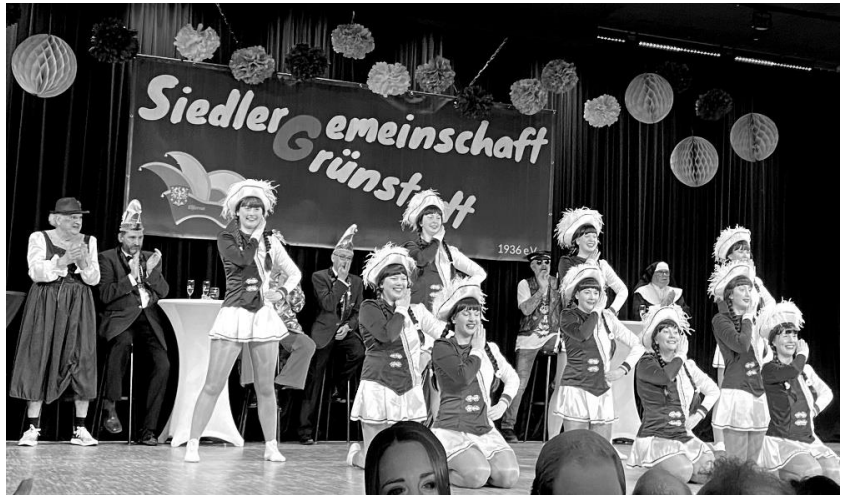
Premiere mit einem erstklassigen Auftritt in beiden Siedler-Prunksitzungen feierten die Gardetänzerinnen „Blaue Funken“ aus Börrstadt.