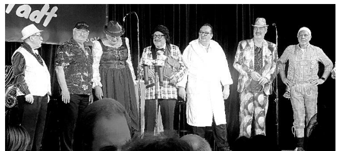
Ein Teil der Siedlergruppe